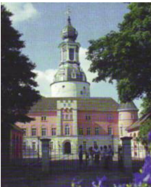
Schloß zu Jever

Maria von Jever wurde am 5. September 1500 als Tochter des Häuptlings Edo Wiemken und seiner zweiten Frau Heilwig von Oldenburg geboren. Edo Wiemken vollendete 1505 den Schlossbau, den sein Vater schon begonnen hatte. Als rechtmäßige Erbin übernahm Maria nach