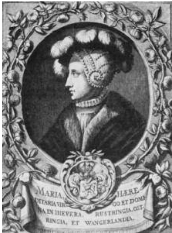
Maria von Jever

seinem Tode die Regentschaft. Sie wurde gleichsam eine mythische Gestalt in der Geschichte von Jever, da mit ihrer Herrschaft „goldene Jahre“ über Jever kamen.