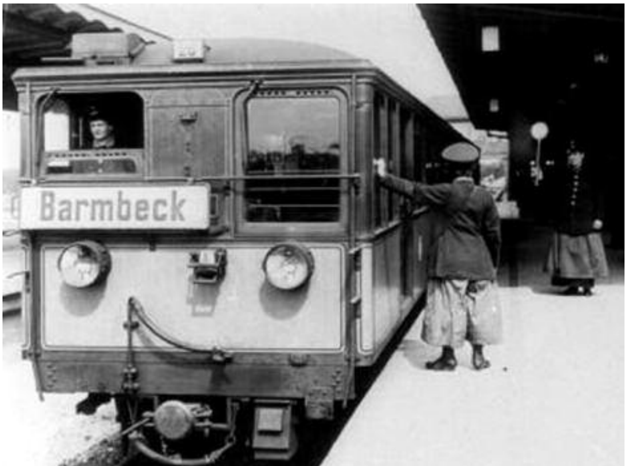
Bahn nach Barmbeck

Ein zweites, nicht ganz so emotional diskutiertes Thema beschäftigte die Volksdorfer sodann. Es handelte sich um die Haltestelle „Volksdorf-Süd“. Die Senatskommission hatte, jedenfalls zunächst, keine Bahnstation zwischen Berne und Volksdorf vorgesehen. Man wollte eine alsbaldige Besiedelung der nahe gelegenen preußischen Gemeinde Meindorf hinauschieben. Für spätere Zeiten sollte allerdings ein Platz in den „Hamburger Tannen“ am Weg Nr. 7 (= Meindorfer